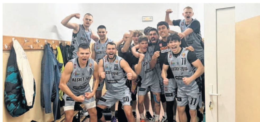
FOT. BASKET 2010 KRUSZWICA