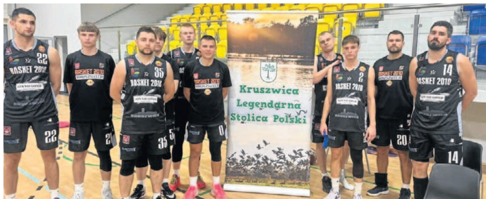
FOT. BASKET 2010