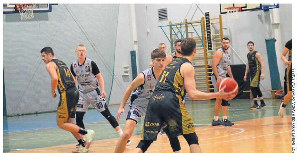
FOT. BASKET 2010 KRZYSZCZYCA/KARZYNA FAJFER