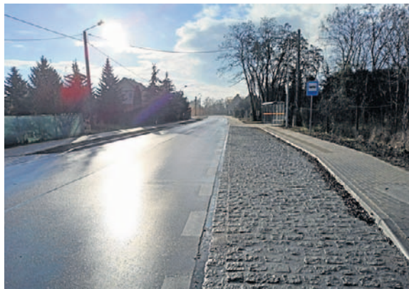
Ubiegłoroczne inwestycje drogowe kosztowały ponad 34 mln zł. Najdroższą była przebudowa drogi powiatowej Nowa Wieś Wielka - Pęczowo, a inowrocławianie bardzo cieszyli się z naprawy ul. Wojska Polskiego.

- To rozmaite staże i szkolenia, dzięki którym ich uczestnicy mają podwyższone kwalifikacje i łatwiej im