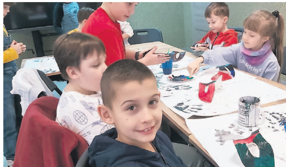
Tak jak nie było nudy podczas ubiegłorocznych półkolonii, tak nudy nie będzie także w tym roku.

Wiele atrakcji przygotowały powiatowe instytucje dla dzieci i młodzieży w okresie nadchodzących ferii. Półkolonie będą odbywały się w Muzeum im. Kana Kasprowicza, Młodzieżowym Domu Kultury im. Janusza Korczaka, a osobny turnus zaplanowano dla podopiecznych placówek opiekuńczo-wychowawczych.