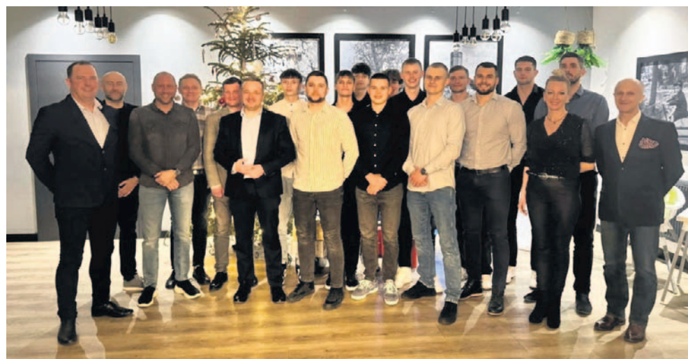
FOT. BASKET 2010 KRUSZWICA