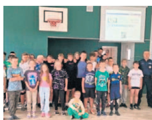
FOT. KPP INOWROCLAW